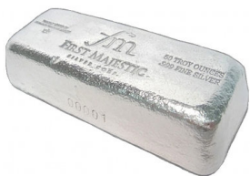
First Majestic Rekordumsatz

Windenergie Folgen der Koalitionsverhandlungen