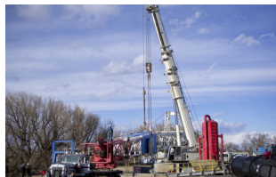
Deutsche Rohstoff Kursrallye